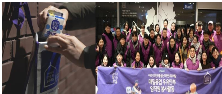
어르신의 안부를 묻는 우유배달 (2016년~)

홀로 사는 어르신의 고독사를 예방하기 위해 매일 우유를 배달하여 안부를 확인하는 공익사업