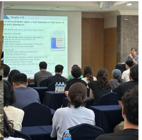
2025년 PKU 가족 성장캠프