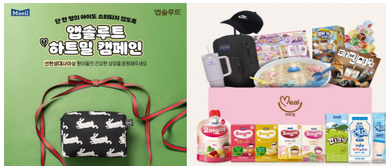
하트밀 캠페인 (2013년~)

홀로 사는 어르신의 고독사를 예방하기 위해 매일 우유를 배달하여 안부를 확인하는 공익사업