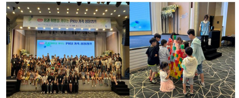
PKU 가족 성장캠프 (2001년~)

'하트밀 굿즈'를 제작·판매하고 판매수익금 전액으로 선천성대사이상 환아들에 '하트밀 박스'를 선물하는 캠페인