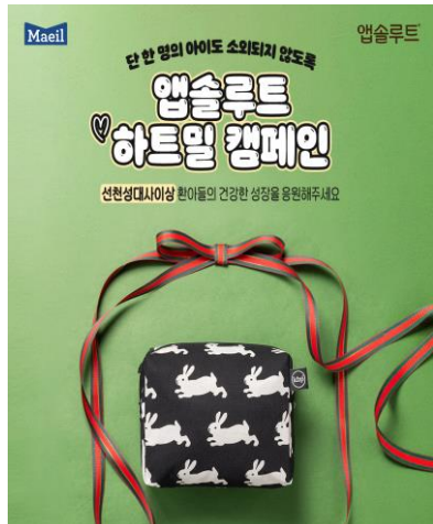
2025년 하트밀 캠페인