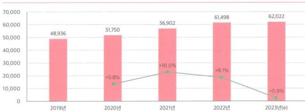
건강기능식품 시장 규모 추이(억 원)

2) 시장의 주요 특성 · 규모 및 성장성 : 2023년 건강기능식품 시장 규모는 전년 대비(6조 1,498억원) 0.9% 성장한 6조 2,022억 원을 기록할 것으로 전망하고 있습니다. 2023년 전체 건강기능식품 시장에서 선물시장은 25.8%, 직접구매(선물 제외) 시장은 72.4%를 차지하고 있으며 선물시장의 비중은 2년 연속 소폭 감소하고 있습니다. '23년에는 전년도와 마찬가지로 선물보다 본인 혹은 가구구성원의 건강관리를 위해 직접 건강기능식품을 구매하는 추세가 나타나고 있으며, COVID19 이후로 건강기능식품에 대한 수요가 꾸준히 증가하고 있어 성장이 지속되고 있는 시장입니다.